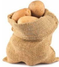
Patates 14 kg