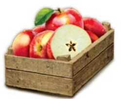
Soğan 19 kg