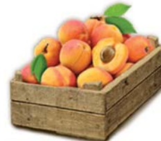
Şeftali 23 kg