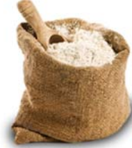
Un 11 kg