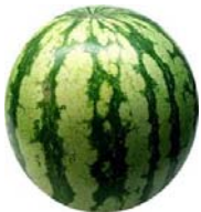
Karpuz 7 kg