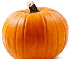
Kabak 9 kg