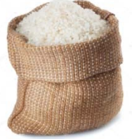
Pirinç 13 kg