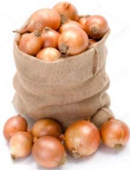
Soğan 16 kg

Tartılan ürünlerin kütlelerini karşılaştırarak altlarına yazalım.